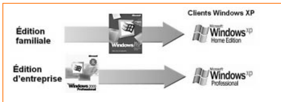
La carte routière de la famille Windows XP

La version professionnelle est le système d'exploitation pour les entreprises car elle inclut plus de fonctions de gestion. Elle inclut des fonctionnalités d'accès distant, de sécurité, de gestion et d'opérations multilingues pour assister les utilisateurs à augmenter leur productivité et connectivité. Tout comme l'édition familiale, la version professionnelle inclut maintenant une capacité de prise de contrôle à distance intégrée directement au système d'exploitation. L'utilisation des services terminaux de Windows permet ainsi à l'entreprise de fournir de l'assistance à distance pour leurs utilisateurs. La même chose s'applique à l'édition familiale, mais cette fois-ci par l'entremise de l'Internet. Ainsi, nous verrons bientôt