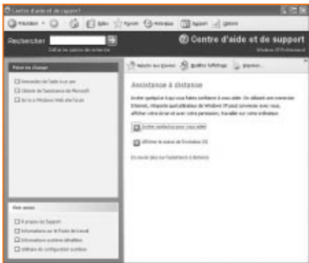
Il est maintenant possible d'inviter quelqu'un à nous aider lorsqu'on rencontre un problème informatique.

méthodes. La première s'applique à l'achat d'un nouvel ordinateur et la deuxième à l'achat du logiciel. Mais les deux méthodes ne requièrent qu'une seule activation.